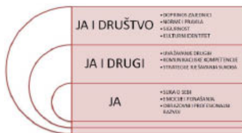
2. slika: Grafički prikaz domena u međupredmetnoj temi Osobni i socijalni razvoj

Razvijanje kritičkog odnosa prema društvenim pojavama i procesima