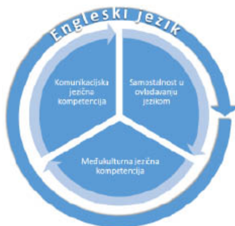
Slika 3: Prikaz zastupljenosti domena u kurikulumu nastavnog predmeta Engleski jezik

Sve tri domene kurikuluma nastavnog predmeta Engleski jezik imaju jednaku postotnu zastupljenost u svim godinama učenja i poučavanja.