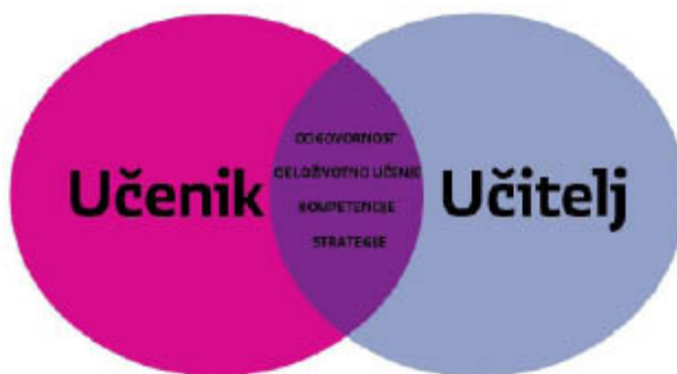
Slika 4: Grafički prikaz odnosa učenika i učitelja

S obzirom na to da je prirodan način usvajanja jezika njegova upotreba i stalna komunikacija, jedan je od objektivnih preduvjeta za ostvarivanje komunikacijskoga pristupa i učinkovito učenje i poučavanje engleskoga jezika rad s manjim brojem učenika u skupini. Preporučuje se grupiranje učenika u obrazovne skupine, ne veće od 15 učenika, unutar jednoga razreda na temelju rezultata dijagnostičkoga mjerenja koje se provodi svake godine uz neophodno omogućivanje horizontalne prohodnosti. Takvo se grupiranje preporučuje od šestog razreda nadalje, vodeći računa o tome da se mješovitim razrednim odjeljenjima u srednjim strukovnim školama omogući podjela prema zanimanjima kako bi se osiguralo adekvatno ovladavanje jezikom struke te da se učenicima kojima je engleski drugi strani jezik prepusti odluka žele li učiti jezik kao početnici ili nastavljači. Grupiranje učenika regulira se kurikulumom škole.