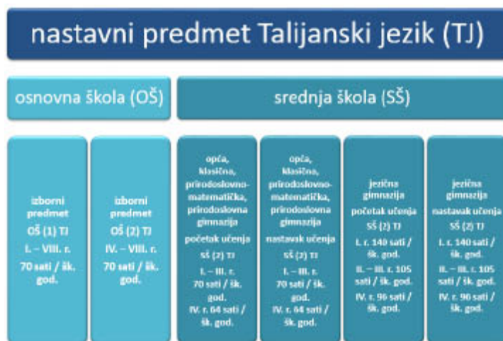
Slika 1. Mjesto nastavnoga predmeta Talijanski jezik u cjelokupnome kurikulumu

Talijanski jezik je i materinski jezik pripadnika talijanske nacionalne manjine i jezik društvene sredine koji omogućuje asimilaciju i interkulturu u dvojezičnim područjima Republike Hrvatske.